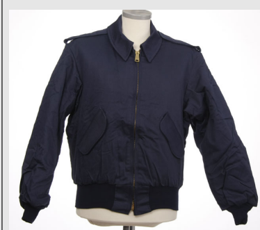
Air Force Security made in USA